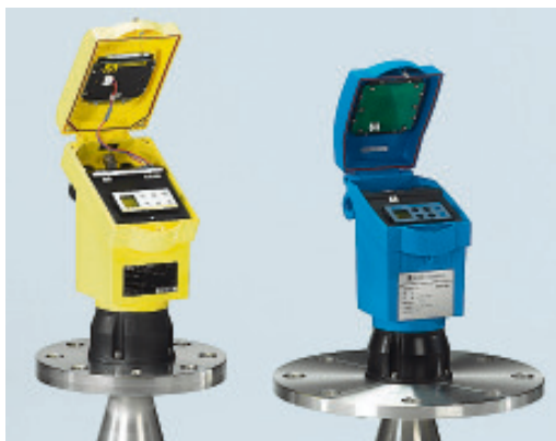
Das Füllstandsmessgerät „Vegapuls 51-54“ der Schiltacher Vega Grieshaber KG (li.) gefiel den „Entwicklern“ eines chinesischen Konkurrenten offensichtlich sehr gut. Sie bauten es einfach nach.