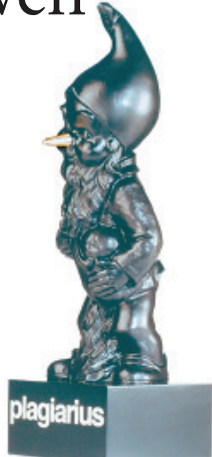
Der schwarze Zwerg wurde von der Aktion „Plagiarius“ bereits zum 29. Mal an besonders dreiste Ideendiebe verliehen.

Erschreckend ist auch die Dreistigkeit der Ideendiebe. Plagiat und Original gleichen sich zumeist wie ein Ei dem anderen. Ein Beispiel dafür sind die Eierbecher „Speedy & Friends“. Die Bocholter Casablanca GmbH hat die putzigen Frühstückshelfer erfunden. Der KarstadtQuelle-Tochter „Mode & Preis“ aus Lörrach war das zunächst al-