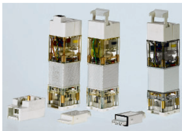
Der Synchron-Motor „Elektra“ von der württembergischen Trietex GmbH wird in China nachgebaut – unerlaubterweise. Das Plagiat (re.) gleicht äußerlich dem aktuellen Original (mitte), enthält aber die Technik eines Vorgängermodells.

Der zweite Preis geht an die Beijing Ripeness Sanyuan Instrumentation Ltd. aus China. Ihr Füllstand-Messgerät ist der Original-Anlage „Vegapuls 51-54“ der Schiltacher Vega Grieshaber KG auffallend ähnlich – innen wie außen. „Entdeckt hat es unsere Beteiligungsgesellschaft im Rahmen einer Wettbewerbsrecherche“, erklärt Pro-