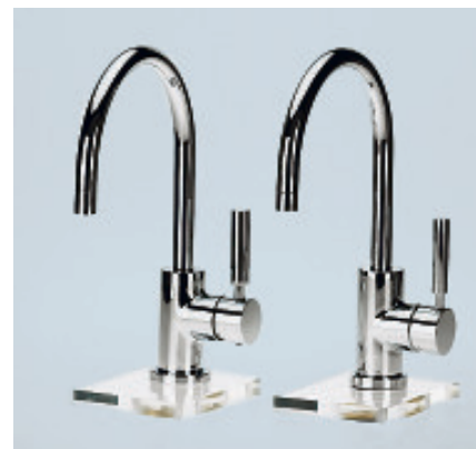
Wer findet den Fehler? Die Waschtisch-Armatur „Tara Classic“ von Sieger Design in Sassenberg ist von der Fälschung (re.) äußerlich kaum zu unterscheiden.